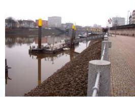
Tiefer 1 und 2 / Weser km 366,2 rechts PKW-Absetzmöglichkeit