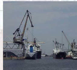
Hüttenhafen Terminal 1 links Terminal 2 rechts