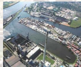
Industriehafen / Kraftwerk Hafen

Auskünfte über Ver- und Entsorgungsmöglichkeiten erteilt das Hafenbetriebsbüro Tel.: +49 (0)421 361-8504